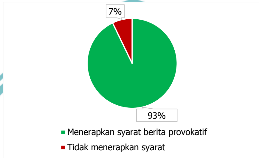
Gambar 5. 1 Diagram Lingkaran Penerapan Judul Berita Provokatif