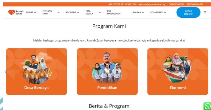
Gambar 1. 1 Laman Website Rumah Zakat

Muzakki bisa mengakses informasi mengenai transparansi keuangan dan pertanggungjawaban dana yang sudah dihimpun di Rumah Zakat websitenya.