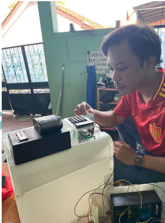
Gambar L- 5 Foto Pengujian