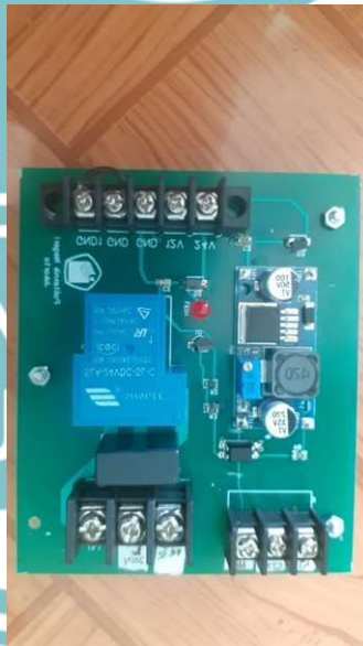
Gambar L- 4 PCB Relay