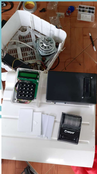
Gambar L-6 Foto alat diuji