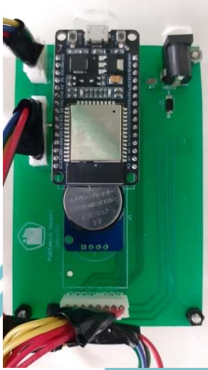
Gambar L- 2 PCB Sistem Pembayaran