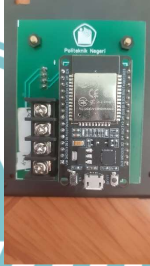
Gambar L- 3 PCB Sistem Pemotong