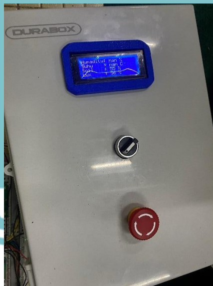
Lampiran 4. Pengujian pembacaan pada LCD I2C