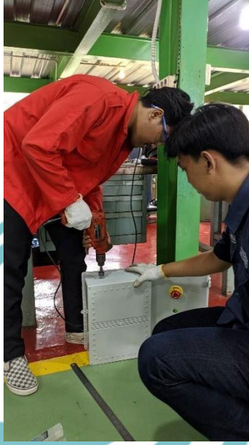
Lampiran 5. Proses pengeboran panel