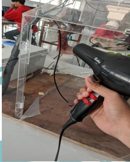
Lampiran 1. Proses pengujian sensor DHT11 menggunakan heater