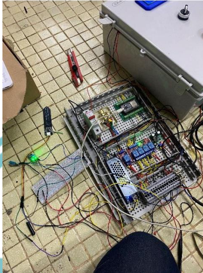
Lampiran 3. Proses perakitan wiring control pada panel