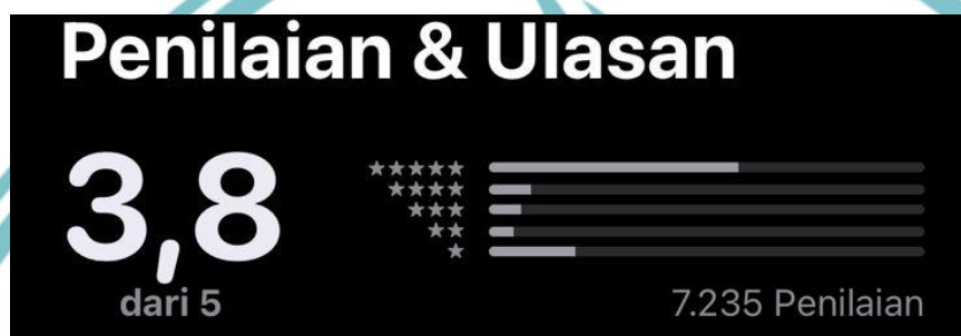
Gambar 1.1 Rating dan Ulasan Aplikasi Neobank

yang telah menyebabkan munculnya banyak bank digital di Indonesia. Bank Neo Commerce merupakan bank digital terbaru yang menawarkan suku bunga tinggi. Namun, berdasarkan tabel 1.2, terdapat penurunan sebesar -4% pada dana pihak ketiga (DPK) pada tahun 2023 meskipun suku bunga telah ditetapkan. Kondisi ini menimbulkan kekhawatiran bagi Bank Neo Commerce dalam upayanya untuk meningkatkan DPK dari tahun ke tahun. Di sisi lain, sekitar 40% nasabah juga mengeluhkan fitur layanan mobile banking pada aplikasi Neobank.