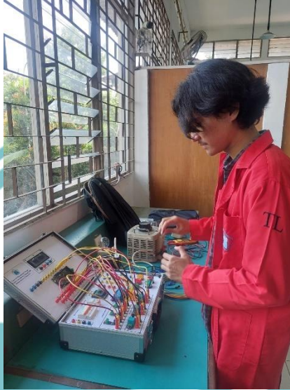
Lampiran 1. Dokumentasi Pengujian Alat serta Pengambilan Data