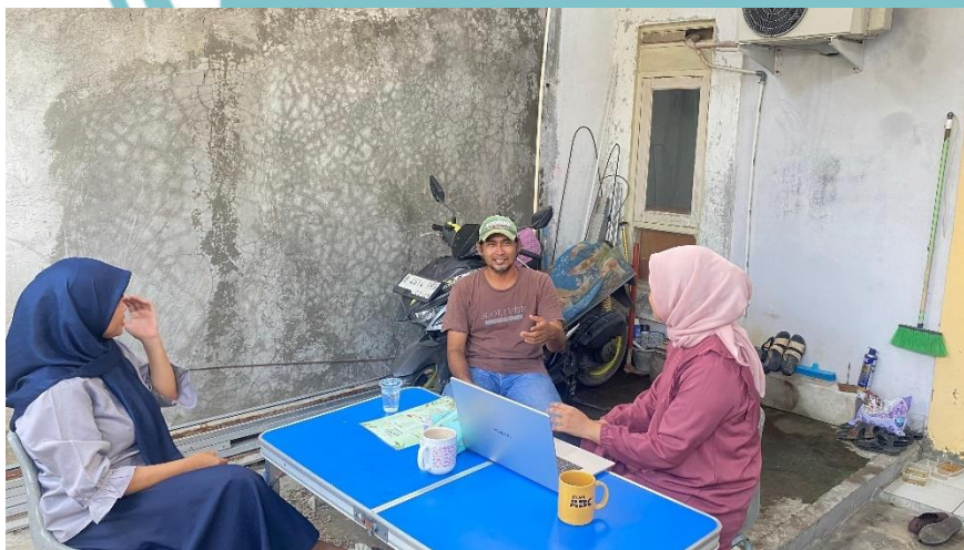
Lampiran 26. Dokumentasi Kegiatan Wawancara bersama Afini Foods