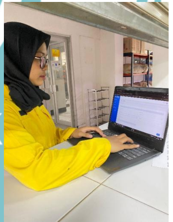
Gambar Realisasi alat di bengkel