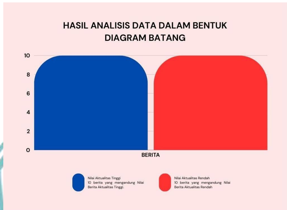
Gambar 5.3.1 Diagram Batang Hasil Analisis.

Dua puluh berita yang telah dianalisis menghasilkan data yang seimbang yakni sebanyak 10 berita dengan Nilai Aktualitas Tinggi dan 10 berita dengan Nilai Aktualitas Rendah.