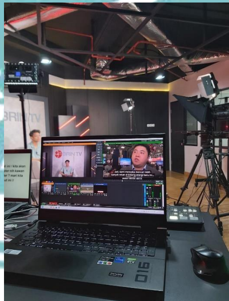
Studio News BRIN TV