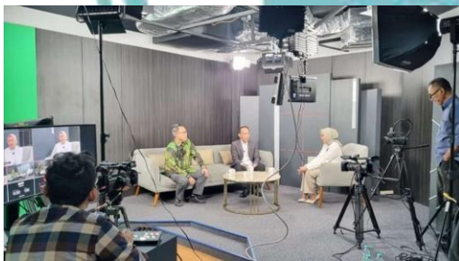
Studio talkshow BRIN TV