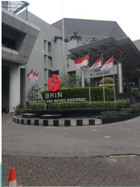
Gedung Badan Riset dan Inovasi Nasional