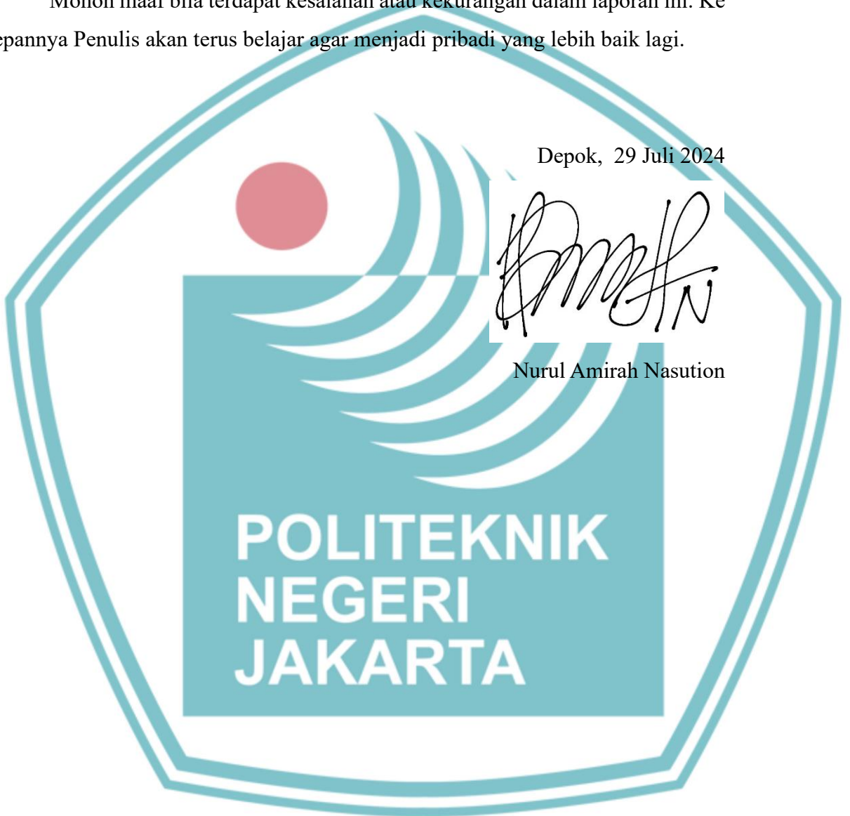
Nurul Amirah Nasution