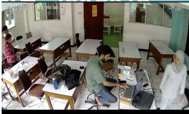
Tampilan gambar pada IP Kamera