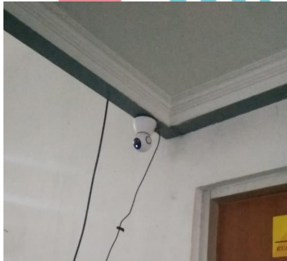
Gambar pemasangan IP Kamera di Lab Jahri