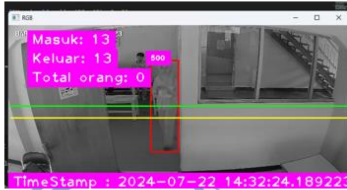
Gambar pendeteksian dan penghitung 1 orang masuk