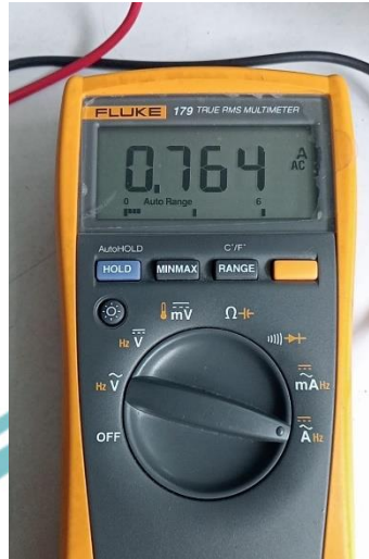
Pengukuran Arus Monitor dengan Multimeter