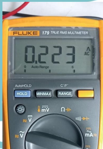
Pengukuran Arus Adapter Laptop dengan Sensor Multimeter