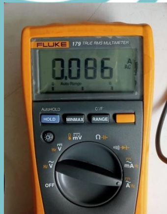
Pengukuran Arus Adapter HP dengan Multimeter

14:19:34.618 -> pzem4===== 14:19:34.652 -> Voltage: 229.40V 14:19:34.652 -> Current: 0.08A 14:19:34.652 -> Power: 10.30W 14:19:34.652 -> Energy: 0.446kWh 14:19:34.652 -> Frequency: 50.0Hz 14:19:34.652 -> PF: 0.53 14:19:34.652 -> Data sent to MQTT topic: pzem4 - 14:19:34.652 ->