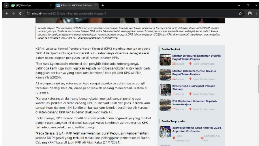
Gambar 1. 2 Tampilan Lead portal rri.co.id

Dalam kanal hukum rri.co.id sendiri, penulisan berita yang efektif menjadi salah satu kunci untuk menarik minat pembaca dan menyampaikan informasi dengan jelas. Salah satunya adalah dengan penggunaan teras berita yang tepat.