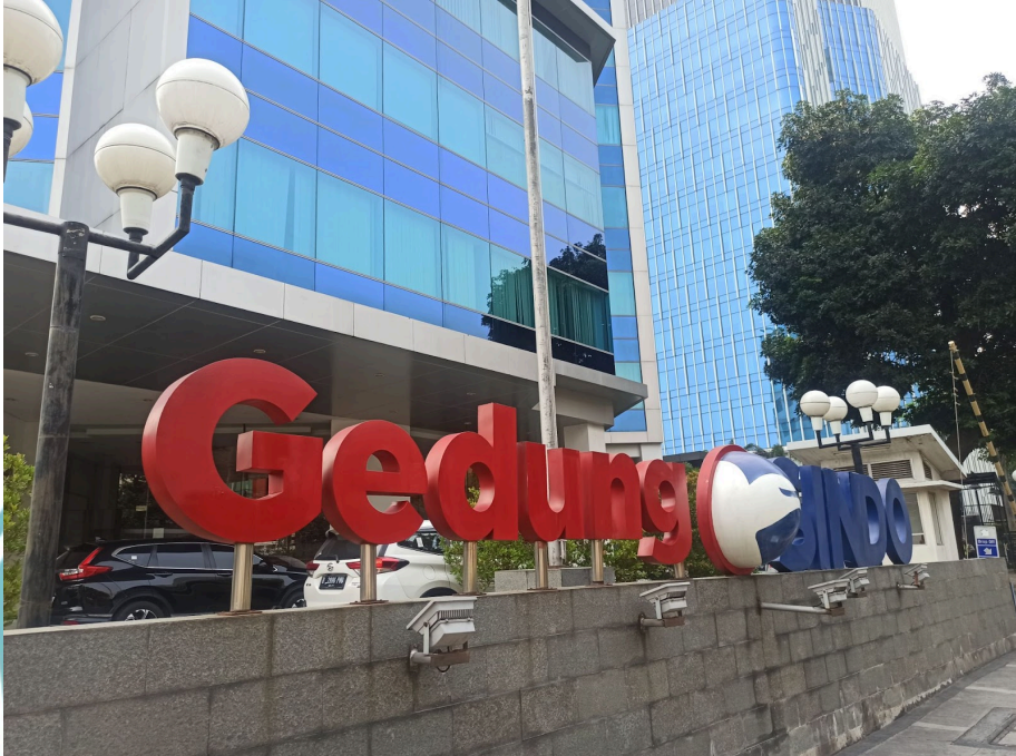
Kantor lama Okezone.com di Gedung SINDO