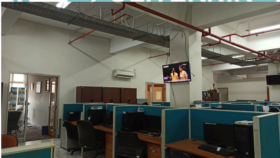
Kantor lama Okezone.com di Gedung SINDO