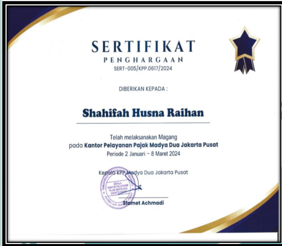
Lampiran 10. Sertifikat Selesai PKL