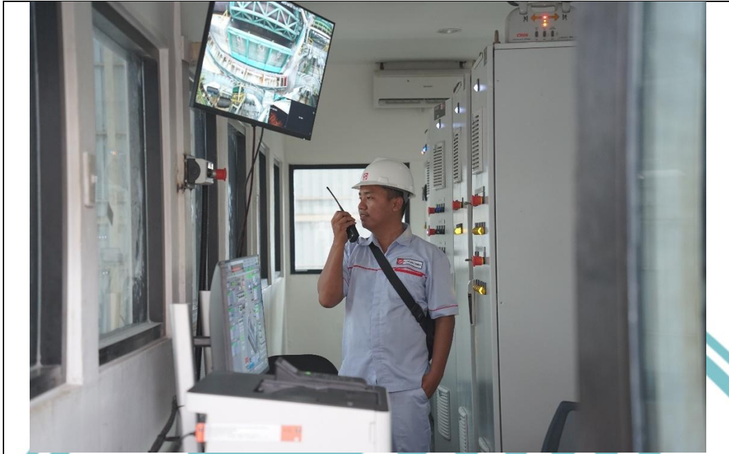
Property owned by PT SMART Tbk