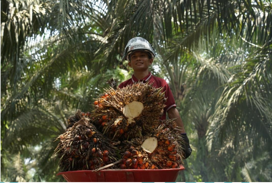
Property owned by PT SMART Tbk