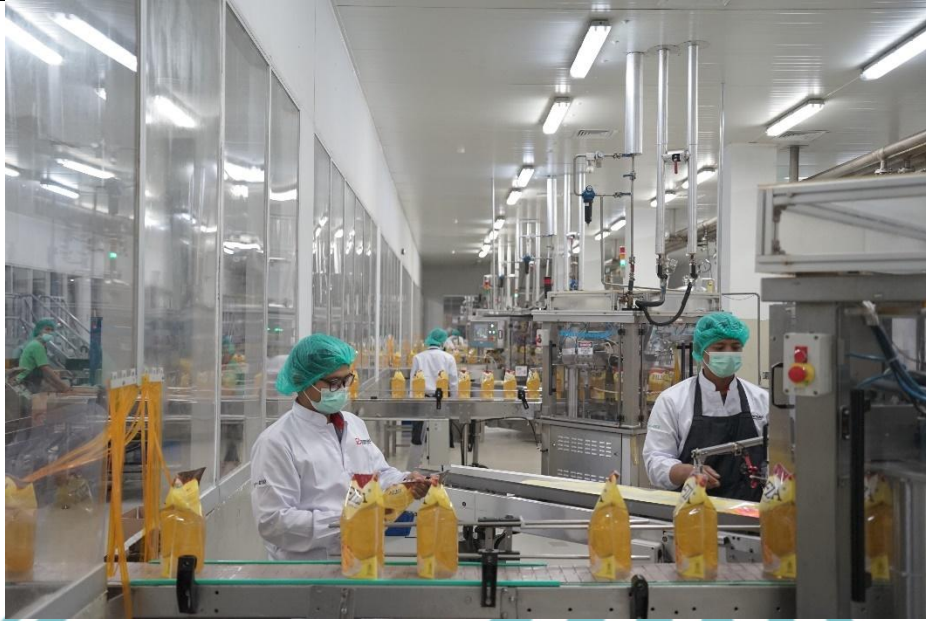
Property owned by PT SMART Tbk