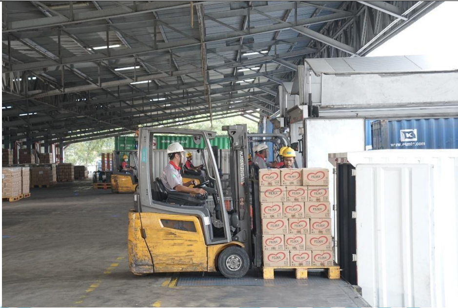
Property owned by PT SMART Tbk