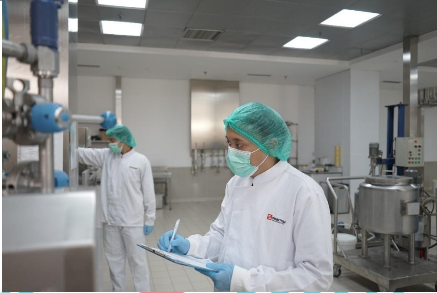
Property owned by PT SMART Tbk