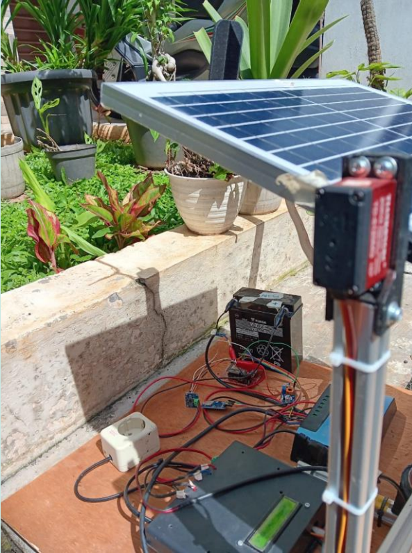
Lampiran 5 Rangkaian Sensor INA219