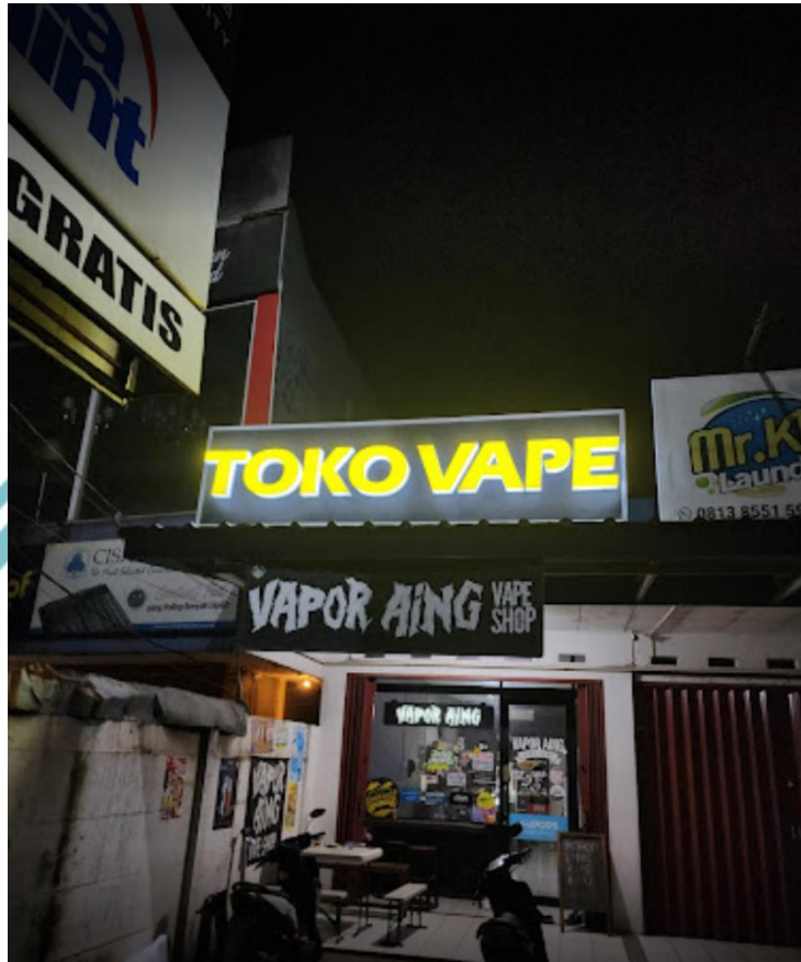
Lokasi bisnis UMKM Vapor Aing