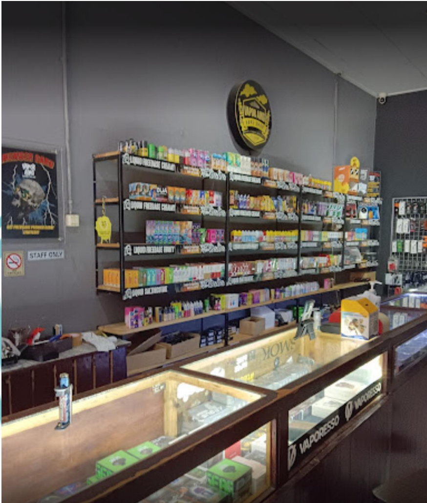
Stok Barang UMKM Vapor Aing