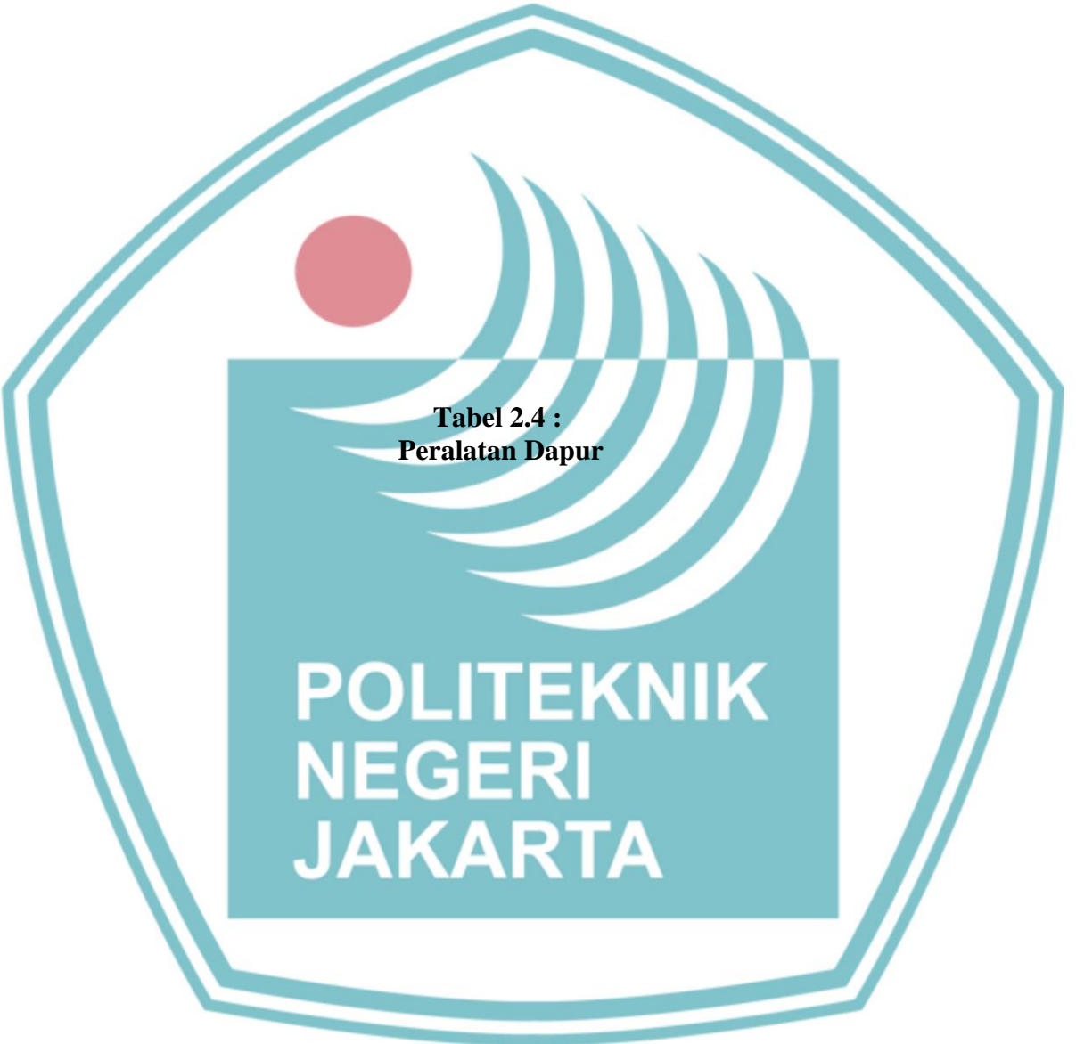
Tabel 2.4 : Peralatan Dapur