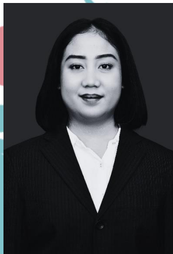
Gambar 2.4 Direktur Keuangan PT Biru Kreasi Nusantara