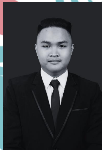
Gambar 2.2 Direktur Utama PT Biru Kreasi Nusantara