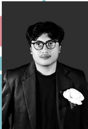
Gambar 2.3 Direktur Pemasaran PT Biru Kreasi Nusantara