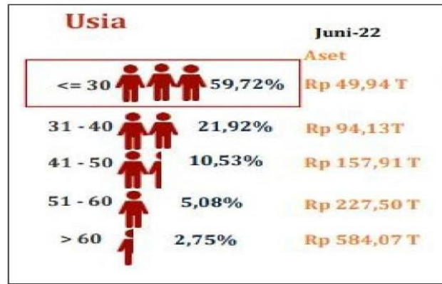
Gambar 1. 3 Demografi Usia Investor Pasar Modal