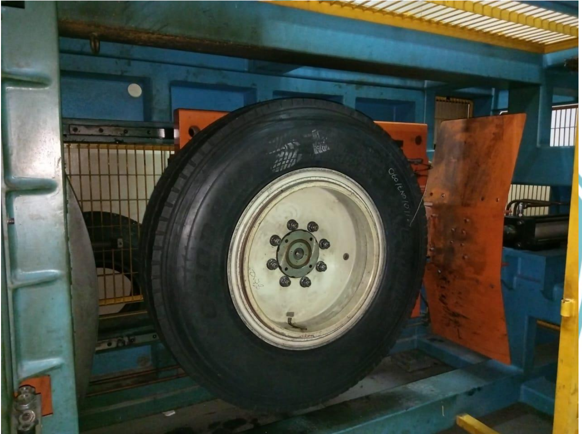
Lampiran 1 Ban Truck yang terpasang pada adaptor posisi 2 Drum test II