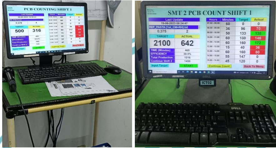
Gambar Display Monitoring Counting