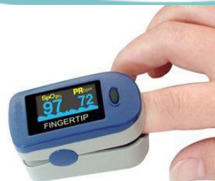
Gambar 1. 1 Vital Sign Checker

Salah satu pelayanan yang dilakukan rumah sakit adalah pemeriksaan tanda-tanda vital pada pasien. Perkembangan teknologi memberikan harapan bagi dunia medis dalam menunjang pelayanan kesehatan. Tanda-tanda vital adalah pengukuran objektif untuk fungsi fisiologis penting dari makhluk hidup. Dinamakan “vital” karena pengukuran dan penilaian dari dokter adalah langkah awal yang sangat penting untuk menemukan suatu gejala dan menentukan diagnosa yang dilakukan oleh dokter atau tenaga medis. (Cooper RJ dkk, 2002)