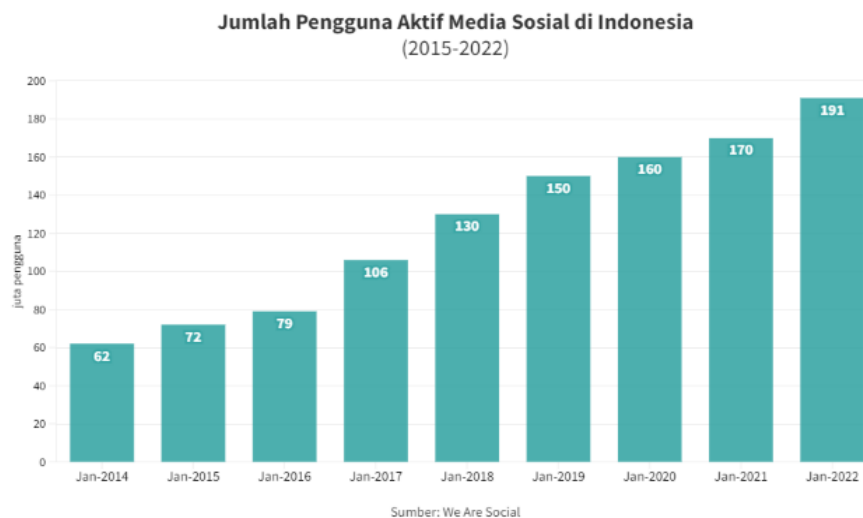
Gambar Jumlah Pengguna Aktif Media Sosial di Indonesia (2015 – 2022)

dibandingkan pada tahun sebelumnya. Data tersebut dapat dilihat pada gambar berikut ini.