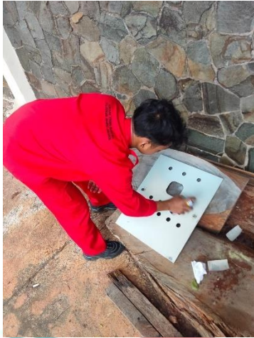
Mempilox panel dengan warna baru