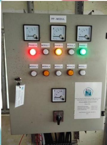
Tampak Depan Panel Modul Pembelajaran Motor 3 Fasa