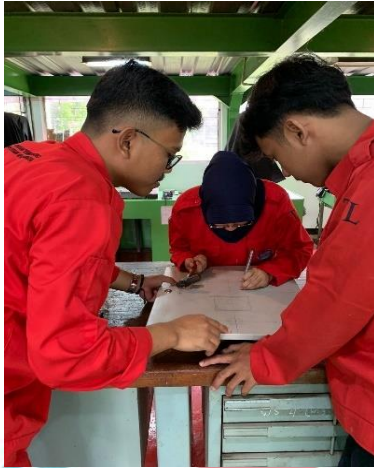
Penitikan bagian panel yang akan di bor