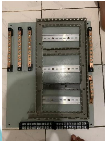
Hasil pemetaan alat komponen pada bagian dalam panel