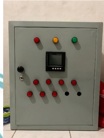
Bagian panel tampak depan