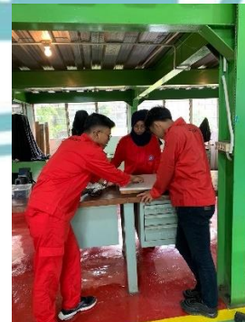
Pemetaan layout alat di bagian dalam panel