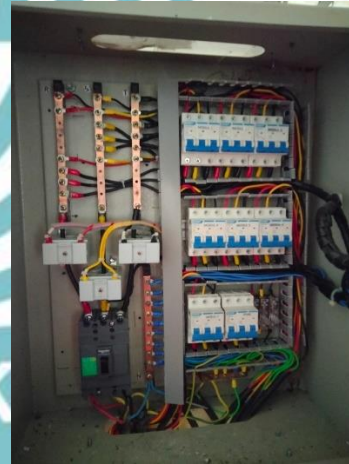
Base Plate Panel Modul Pembelajaran Motor 3 Fasa