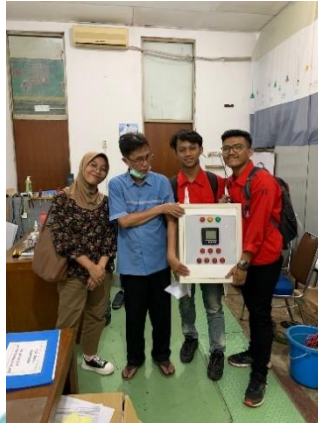
Serah terima panel yang akan dikembangkan