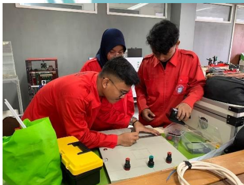
Pemetaan layout alat di pintu panel