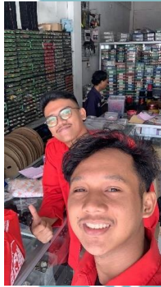
Pembelian material/komponen di toko PCM