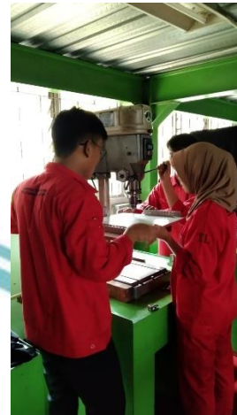
Pemboran bagian panel yang akan diletakkan komponen