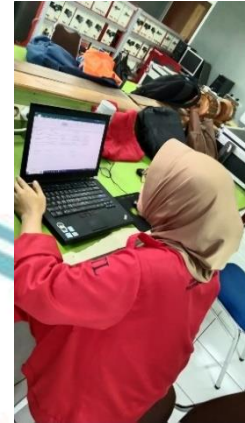
Pembuatan daftar material/komponen