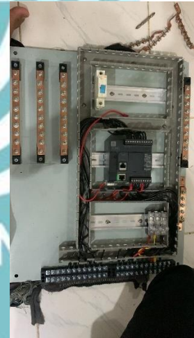
Progres wiring alat tugas akhir