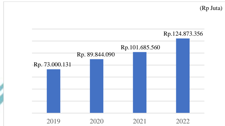
Tabel 1.1 Pembiayaan Akad Murabahah Tahun 2019 - 2022

Sumber: Laporan Tahunan (BSI, 2021) dan Laporan Tahunan (BSI, 2022)