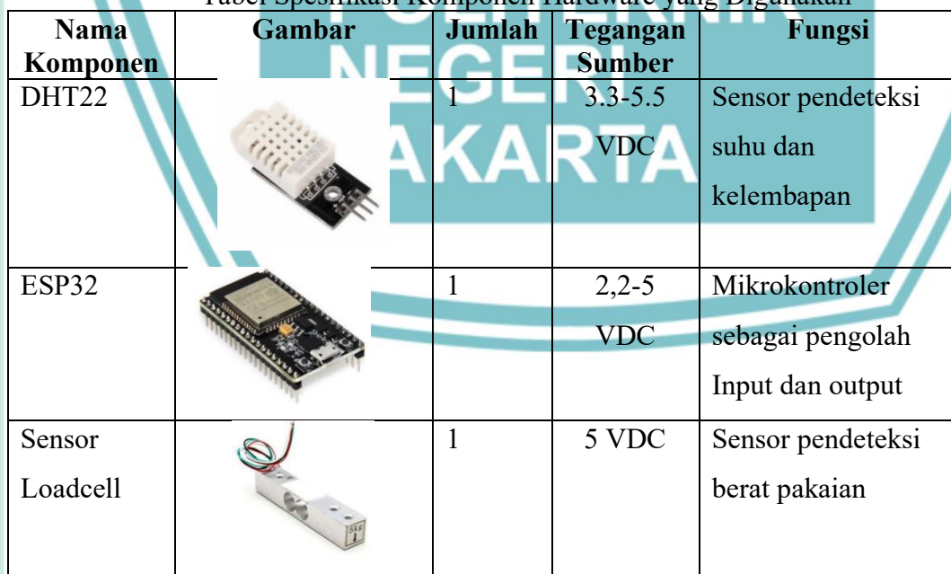
Tabel Spesifikasi Komponen Hardware yang Digunakan