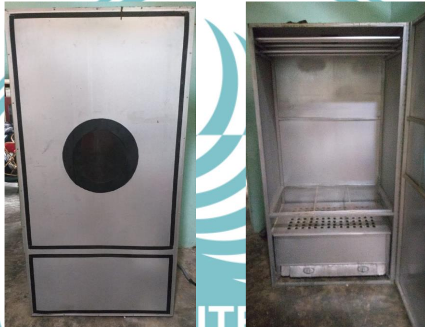
a) Tampak depan

dengan bapak Prasetio bahwa pengeringan menggunakan energi panas matahari masih kurang efektif pada saat musim hujan. Bapak Prasetio menggunakan lemari pengering untuk mengeringkan pakaian yang terdiri dari kompor gas dan kipas dc yang dinyalakan secara maual agar tidak terjadi kebakaran. Hal ini disebabkan oleh lemari yang tidak memiliki sistem otomatis untuk menghentikan proses pengeringan pakaian ketika sudah kering. Bentuk dari pengeringan pakaian seperti ditunjukkan pada Gambar 1.1.