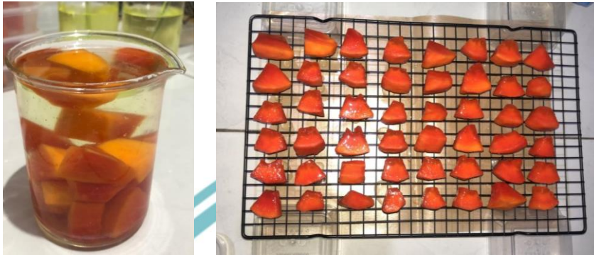
Lampiran 1. Proses Pembuatan Edible Coating dan Pengaplikasian pada Pepaya Potong