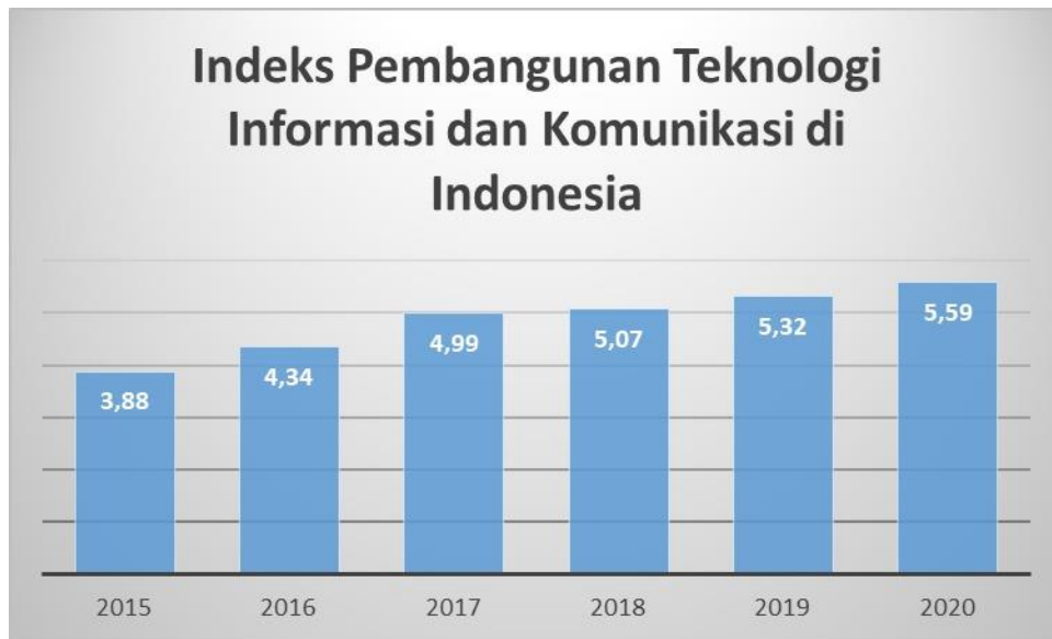
Gambar 1. Indeks Pembangunan TIK di Indonesia