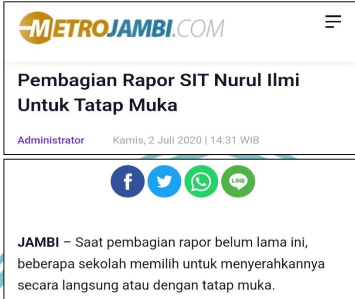
Gambar 1.1 Tangkapan Layar Bukti Fakta Judul dan Lead yang Tidak Memiliki Unsur Representatif 1