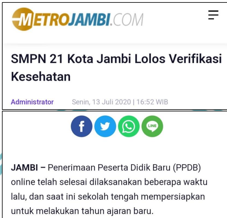
Gambar 1.3 Tangkapan Layar Bukti Fakta Judul dan Lead yang Tidak Memiliki Unsur Representatif 3