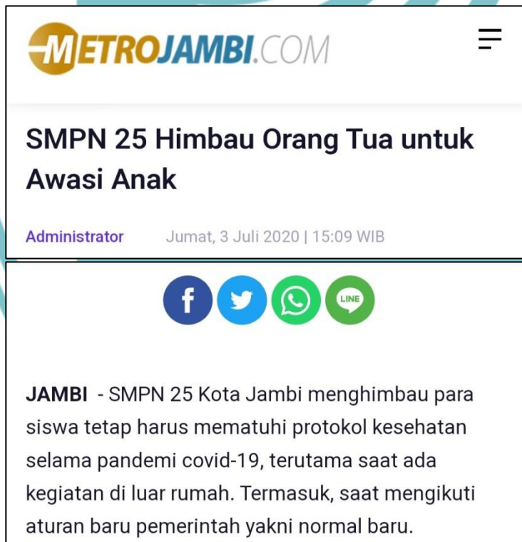
Gambar 1.2 Tangkapan Layar Bukti Fakta Judul dan Lead yang Tidak Memiliki Unsur Representatif 2