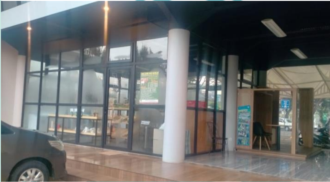
Kopi Sepanjang Waktu