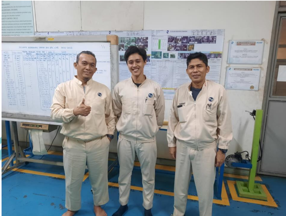
Lampiran 2 Foto Dengan Chief Quality dan Head Departemen GDC