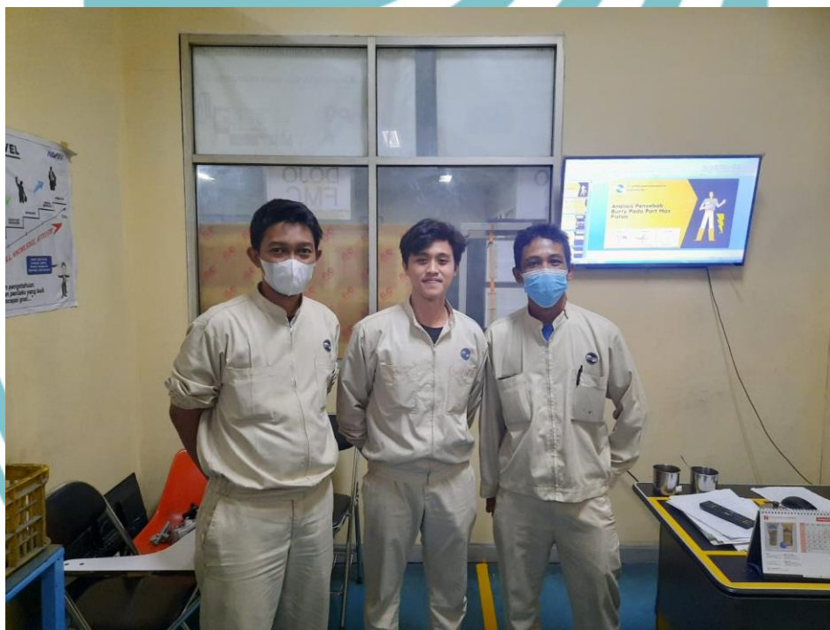
Lampiran 3 Foto Dengan Mentor dan Staff Quality Departemen GDC