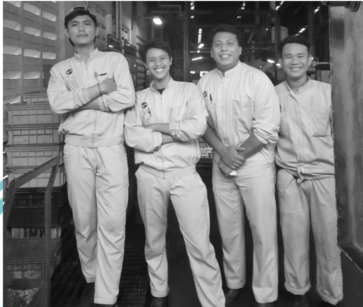
Lampiran 4 Foto Operator GDC