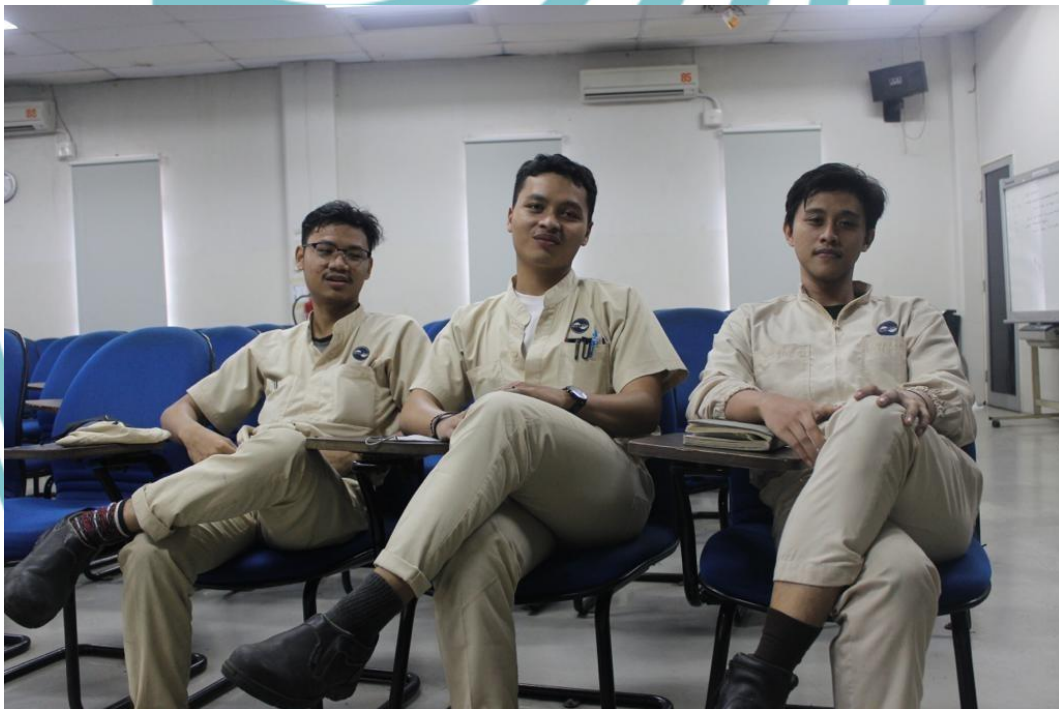
Lampiran 5 Foto Dengan Teman Teman Magang