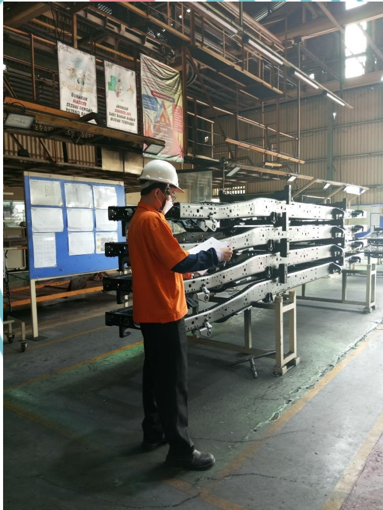
Melakukan pengecekan area PDC.