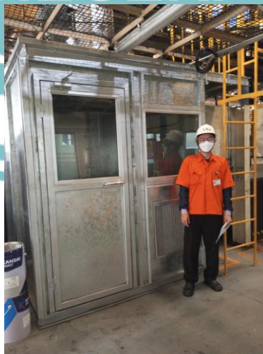
Instalasi Mixing Room Painting 1