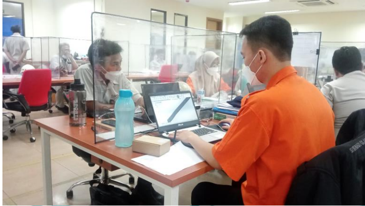
Kegiatan selama di Office Engineering