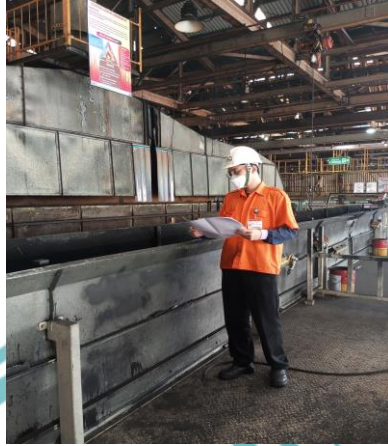
Melakukan Pengecekan Spray Booth Painting 2