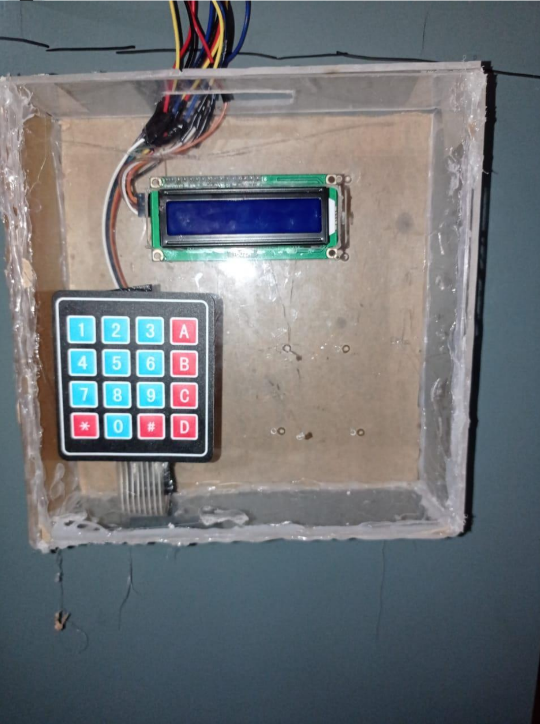
Box yang digunakan untuk Keypad dan LCD