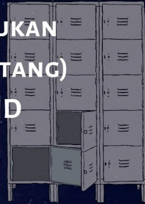
Poster SOP Cara Penggunaan Alat