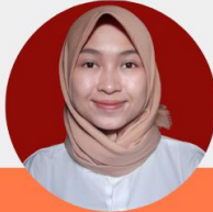
FEBRISHA Bogor, 13 Feb 2000