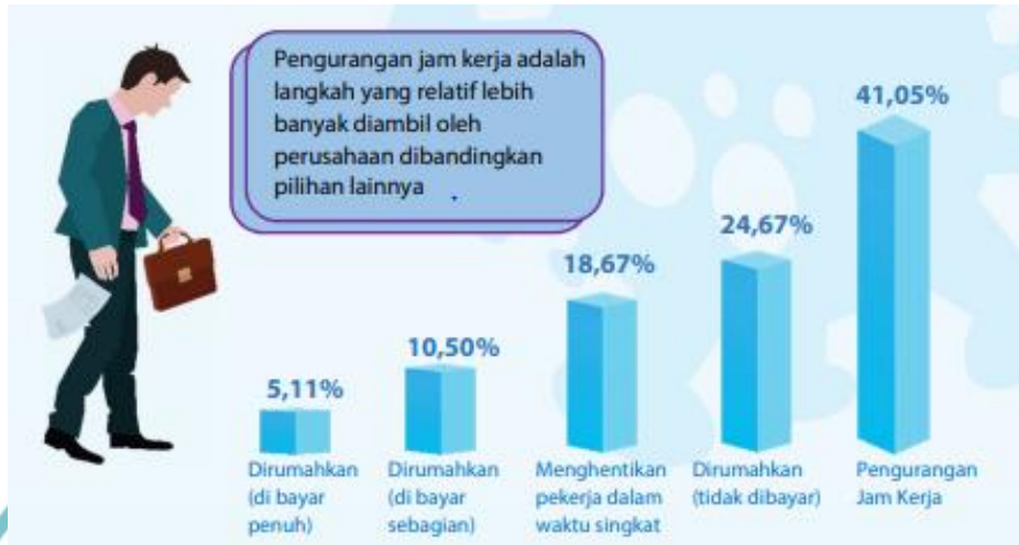
Gambar 1.4 Tindakan Pelaku Usaha terhadap Tenaga Kerja Saat Pandemi

Pontianak, juga menyebutkan bahwa terdapat penurunan pendapatan masyarakat khususnya masyarakat di Pontianak sebesar 30% -70% di awal masa pandemi.