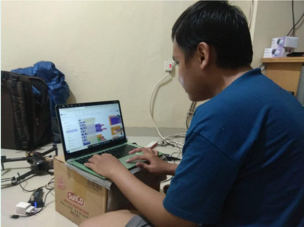
Foto saat memprogram aplikasi Monitoring Urban Farming