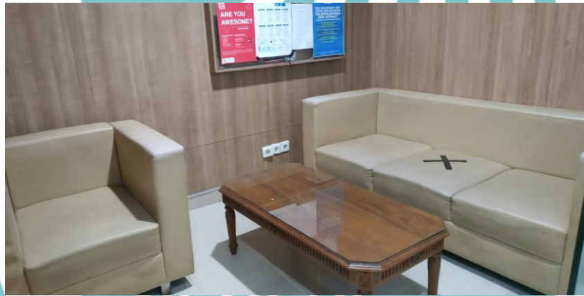
Gambar 1. 1. Ruang Tunggu Tamu

Gedung Direktorat Politeknik Negeri Jakarta (PNJ) merupakan tempat berlangsungnya berbagai macam aktivitas sebagaimana kantor pada umumnya. Berbagai aktivitas tersebut sering melibatkan orang dari luar kampus untuk bertemu dengan dosen atau pegawai lainnya yang ada di Gedung Direktorat. Sebelum dapat ditemui oleh yang bersangkutan, resepsionis akan mengarahkan setiap tamu untuk menunggu di salah satu dari tiga ruang tunggu yang ada di lantai tiga. Oleh karenanya, resepsionis harus mengetahui status keterisian setiap ruang tunggu.