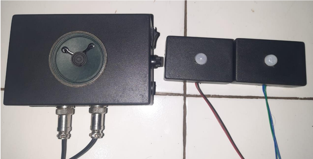
Gambar L.1 Foto Keseluruhan Alat