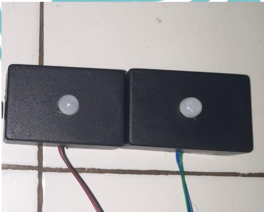
Gambar L.2 Bentuk Fisik Sensor PIR