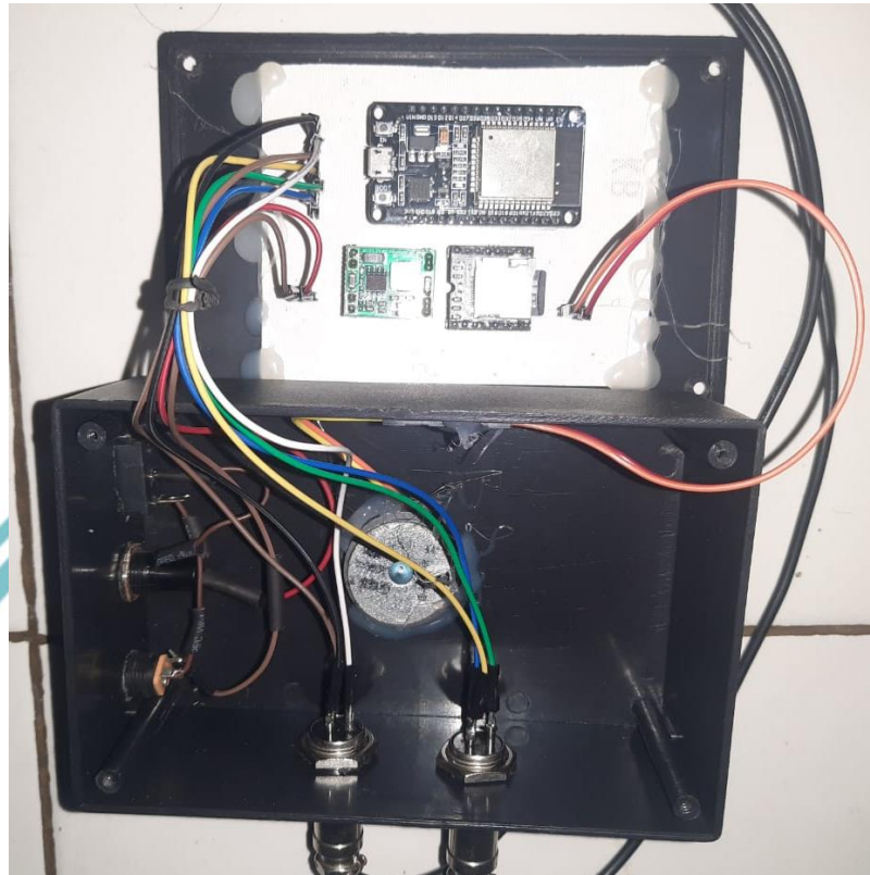
Gambar L.3 Fisik Dalam Box Alat