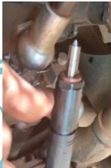
Gambar 1.2 Tidak adanya bahan bakar yang keluar dari injector (tersumbat)

kerusakan pada sistem bahan bakar tersebut membuat unit backhoe loader tidak dapat dioperasikan. Akibat dari kerusakan tersebut maka akan mengganggu proses produksi sehingga produksi tidak sesuai target dan akan menimbulkan kerugian lain berupa biaya tambahan untuk overtime karyawan.