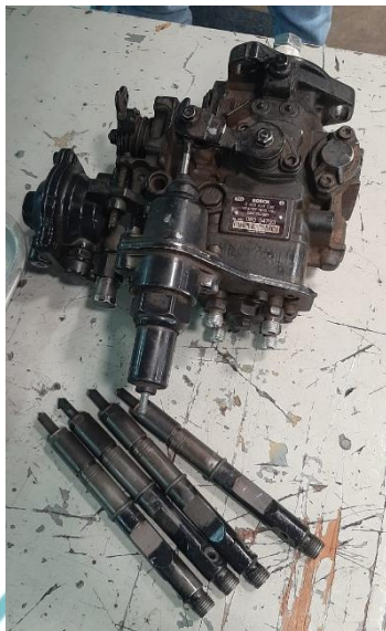
Gambar 1.1 fuel injection pump dan injector yang rusak