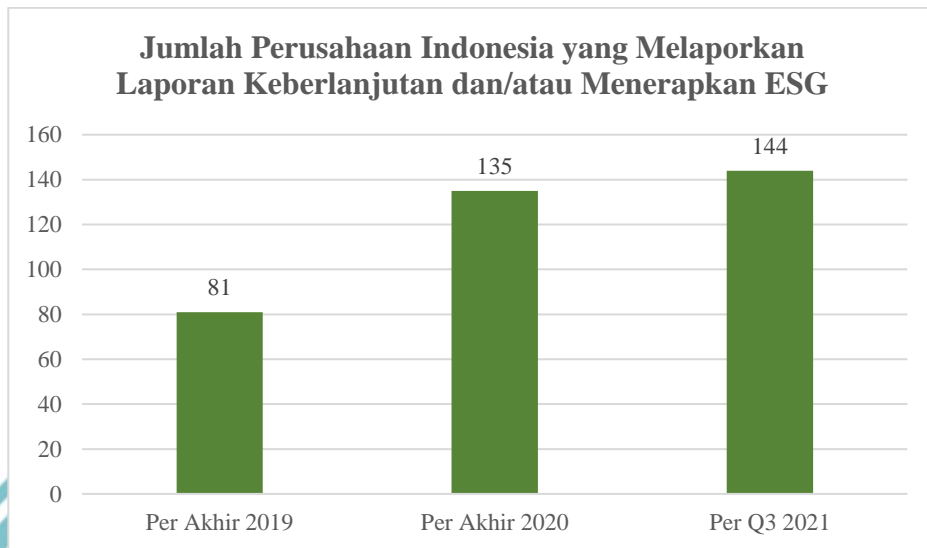
Gambar 1. 2 Pertumbuhan Perusahaan Indonesia yang Melaporkan Keberlanjutan dan/atau Menerapkan ESG