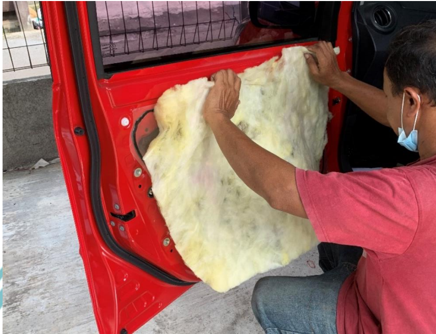
Lampiran 1 Proses pemasangan material peredam