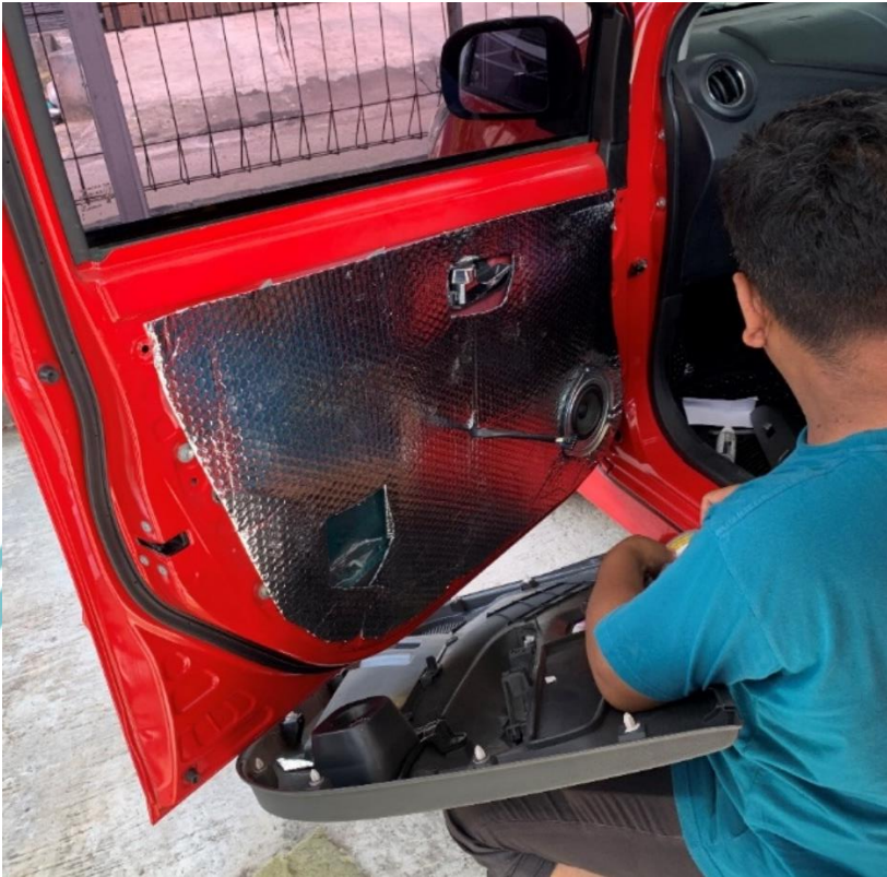
Lampiran 3 Pemasangan kembali doortim pintu