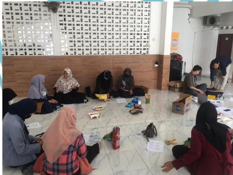
(Foto Kegiatan Evaluasi Bulanan Program Pendidikan Sanggar Genius LAZNAS Yatim Mandiri KC Jakarta Timur)