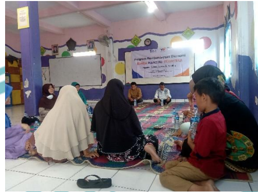
Dokumentasi observasi kegiatan pembinaan program BISA LAZNAS Yatim Mandiri