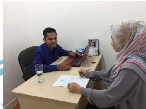
Dokumentasi wawancara dengan pengurus LAZNAS Yatim Mandiri