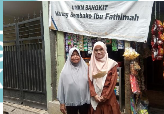
Dokumentasi wawancara dengan penerima bantuan Program BISA LAZNAS Yatim Mandiri