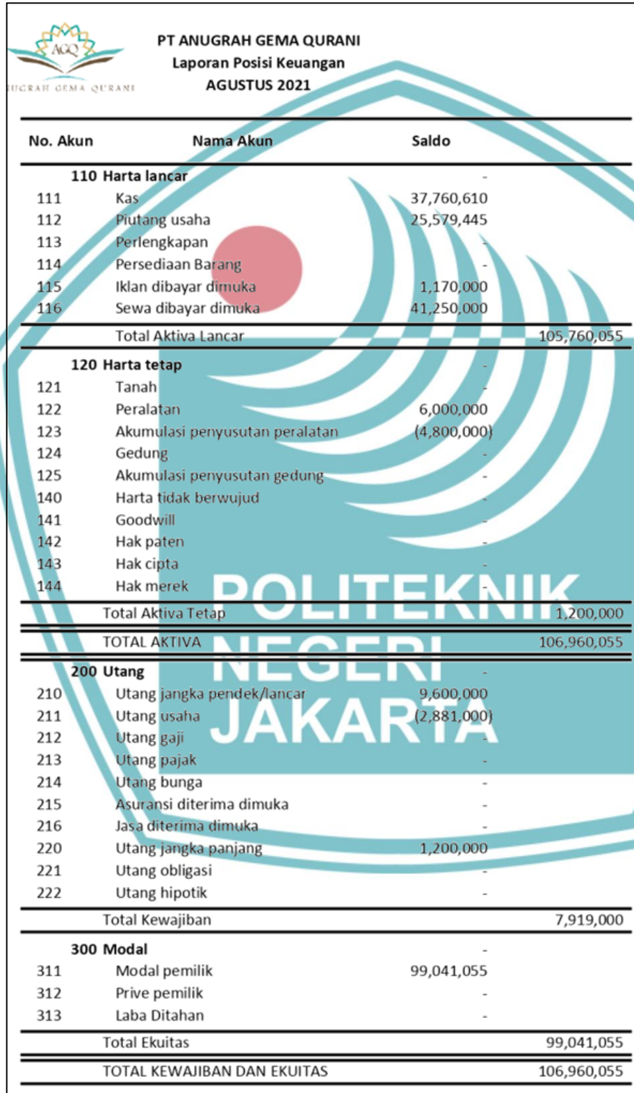
Lampiran 6. Laporan Posisi Keuangan periode Agustus 2021 pada PT Anugrah Gema Qurani