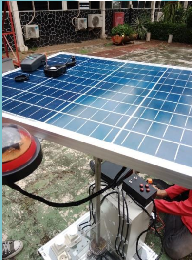
Gambar dokumentasi pengujian alat sistem sun tracker