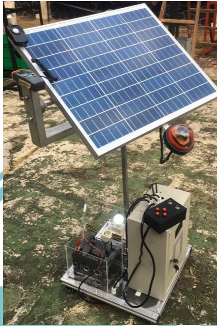
Gambar dokumentasi alat