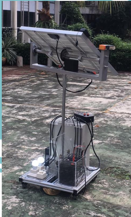
Gambar dokumentasi alat