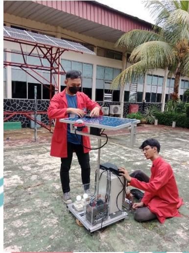
Gambar dokumentasi uji coba sistem kontrol sistem sun tracker