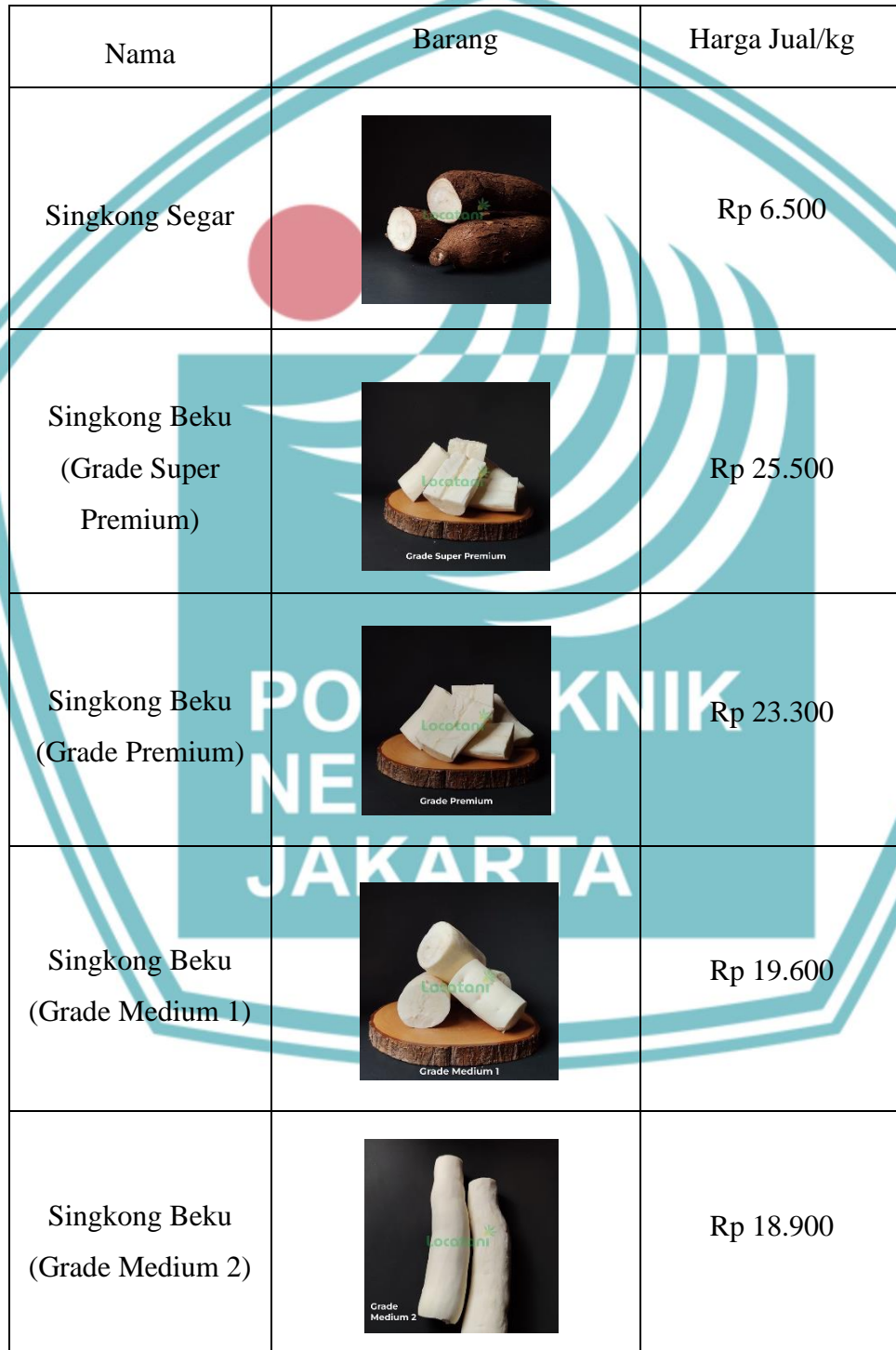
Lampiran 1: Produk