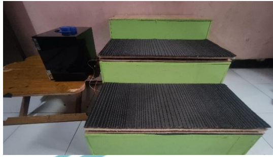
Gambar L- 1 Foto Keseluruhan Alat