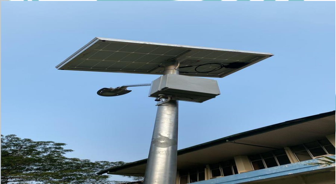
Tiang PDU setelah terpasang dengan PV