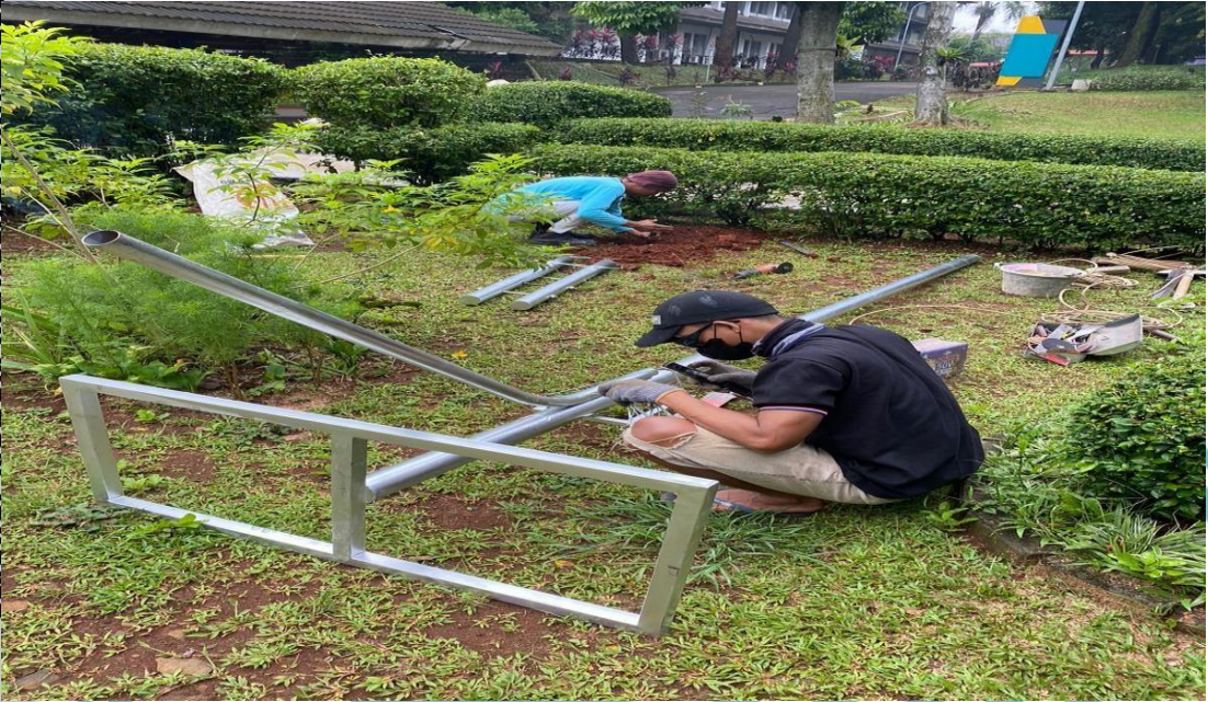
Pembuatan kerangka tiang PDU