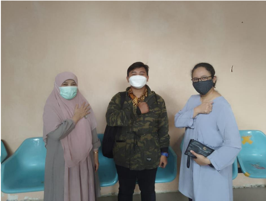
Lampiran 4. Dokumentasi Pengambilan Data Primer untuk Kalibrasi