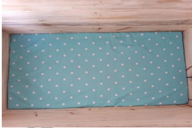
Gambar L2. 6 Pemasangan Kasur Balita (1)