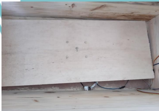
Gambar L2. 5 Pemasangan Triplek diatas Rangka Penyangga Sensor Loadcell