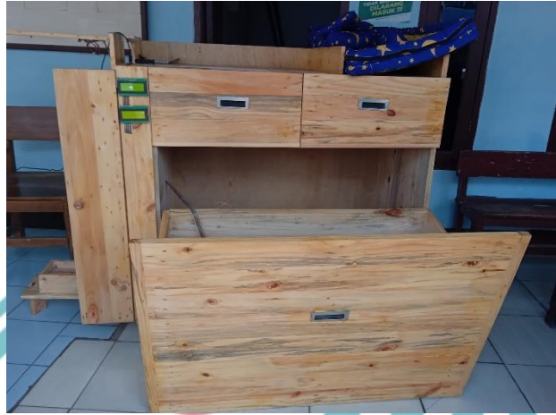
Gambar L2. 1 Tampilan Alat