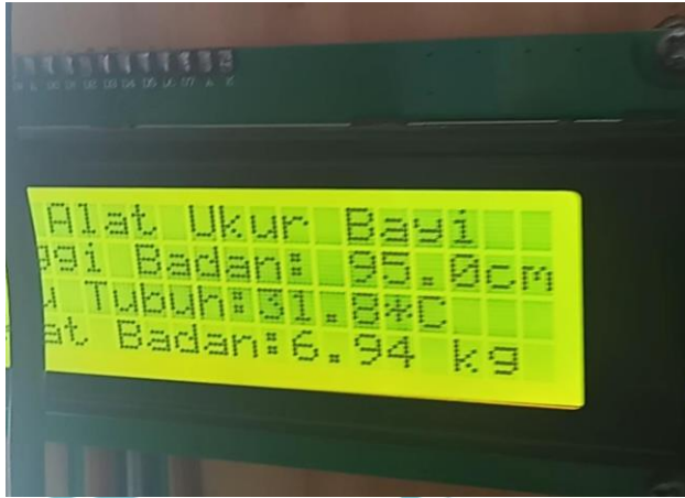
Gambar L2. 3 Tampilan Output Alat Ukur Balita pada LCD