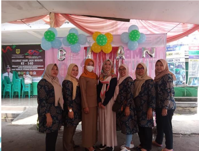
Gambar L2. 9 Foto Bersama Kader Posyandu