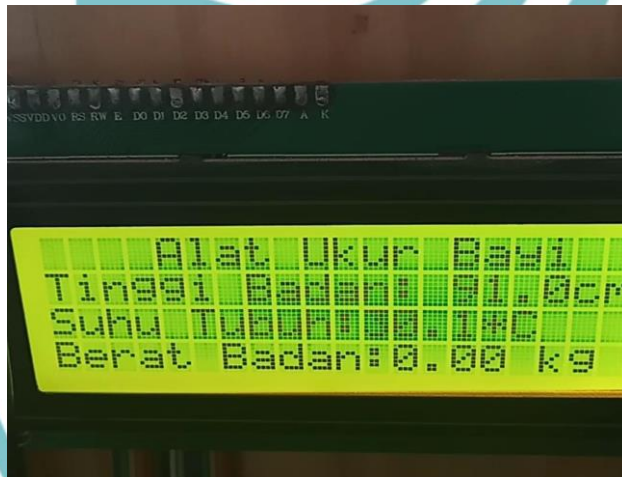
Gambar L2. 2 Tampilan Menu Utama pada LCD