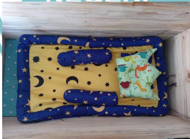
Gambar L2. 8 Rangka Penimbang Balita