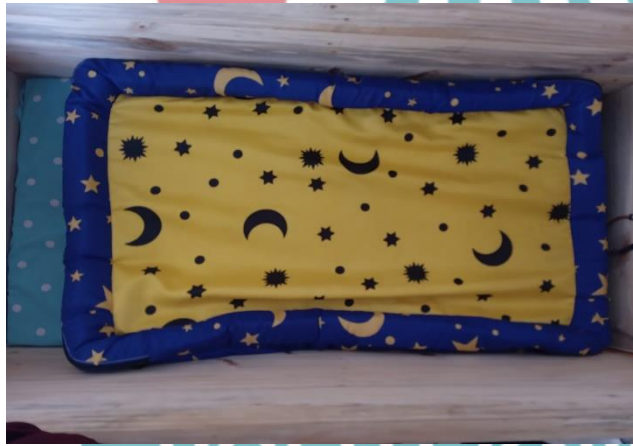
Gambar L2. 7 Pemasangan Kasur Balita (2)