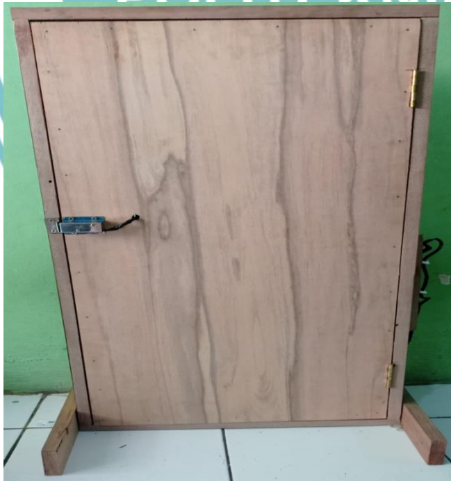
Gambar L-2 Pintu Otomatis Tampak Belakang