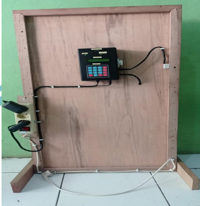
Gambar L-1 Pintu Otomatis Tampak Depan