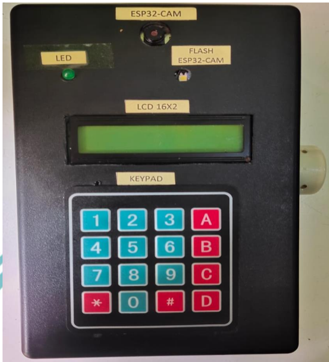
Gambar L-3 Box Casing Pintu Otomatis